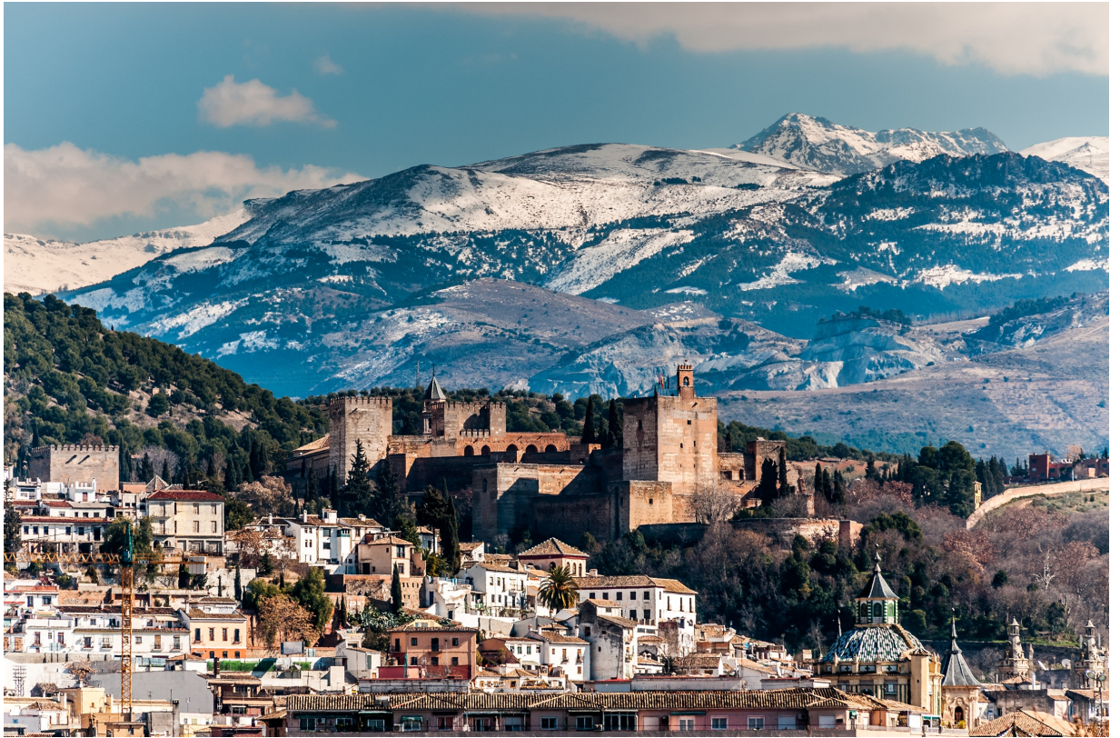
Incoming Students / Movilidad Entrante