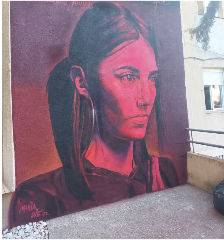
Acto Homenaje a Gata Catana. Mural