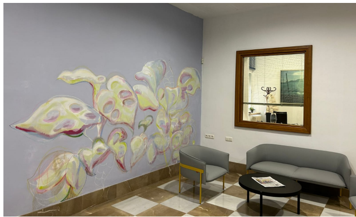
Resultado Proyecto Habita