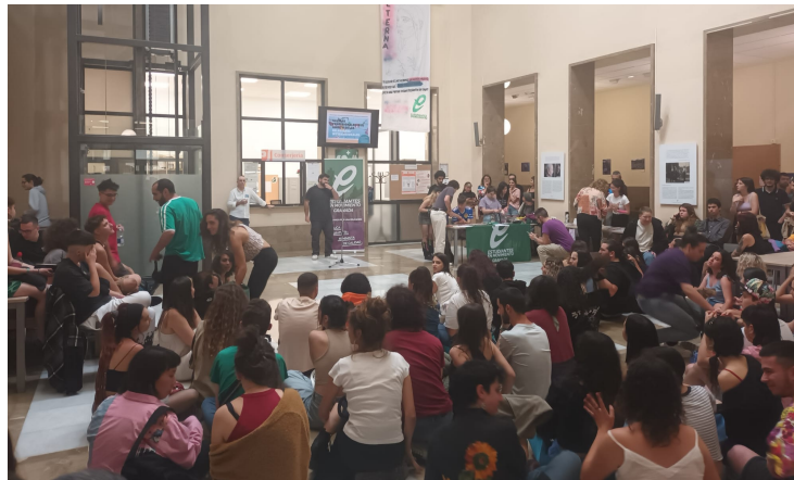
Acto Homenaje a Gata Catana. Mural