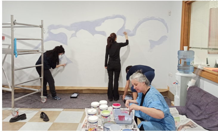
Proceso de creación del Proyecto Habita