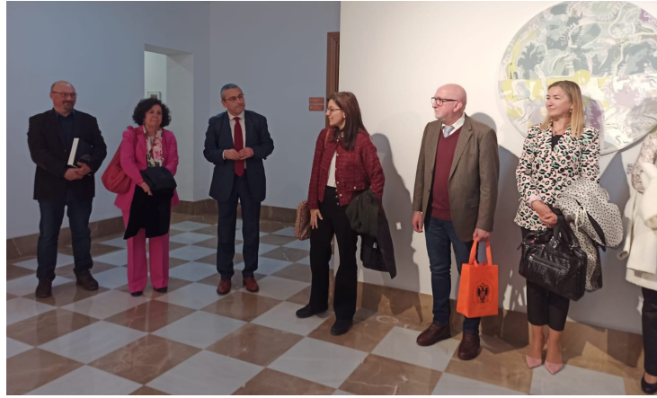
Inauguración Espacio Habita